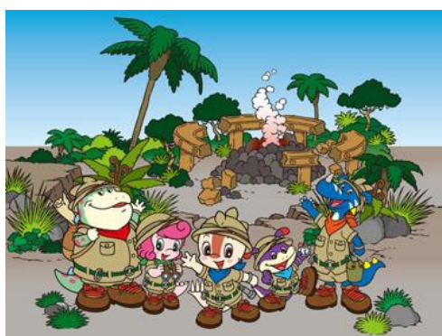
オリジナルキャラクター