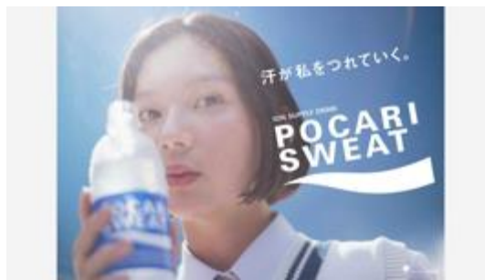
大塚製薬 ポカリスエット 2022 グラフィック

【総合演出企画、体験・空間設計】「新しい映像体験」を作り出し、総合エンターテインメントの開発・プロデュースを行っています。