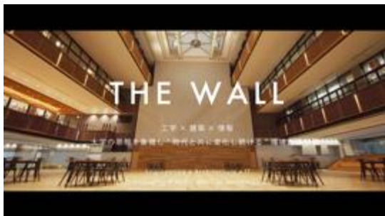
工学院大学 キネティックウォール「THE WALL」

【総合演出企画、体験・空間設計】「新しい映像体験」を作り出し、総合エンターテインメントの開発・プロデュースを行っています。