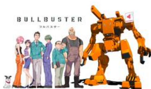
“経済的に正しい”ロボットヒーロー物語「ブルバスター」