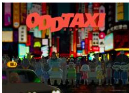
オリジナルアニメ「オッドタクシー」

【自社オリジナルコンテンツ】オリジナリティのある原作開発、企画、制作に加え、ビジネスプロデュースからプロモーションまで幅広く手がけています。