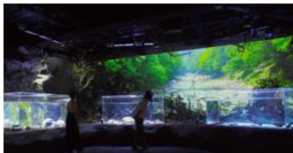
カワスイ川崎水族館 空間演出映像

【自社オリジナルコンテンツ】オリジナリティのある原作開発、企画、制作に加え、ビジネスプロデュースからプロモーションまで幅広く手がけています。